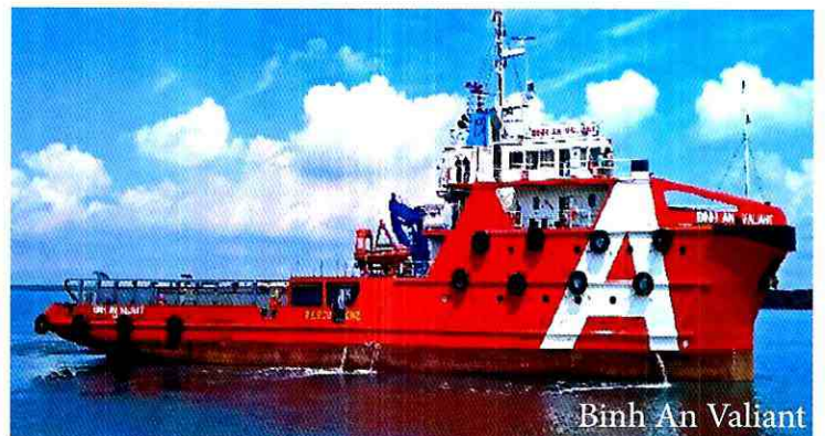
Binh An Valiant