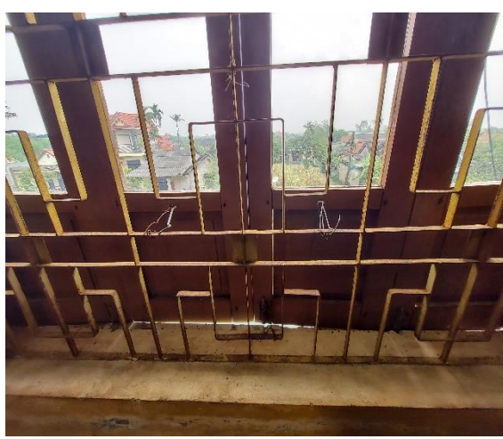
Tất cả các cửa sổ dãy nhà 2 tầng bị hỏng, xoạc cánh không đóng được trong mùa mưa bão