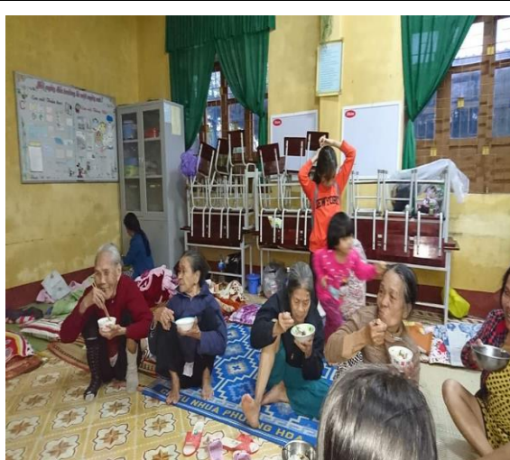
Hình ảnh người dân sinh hoạt trong lúc trú bão, lụt