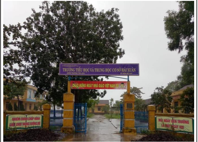
Ảnh cổng trường khu vực Trà Lộc