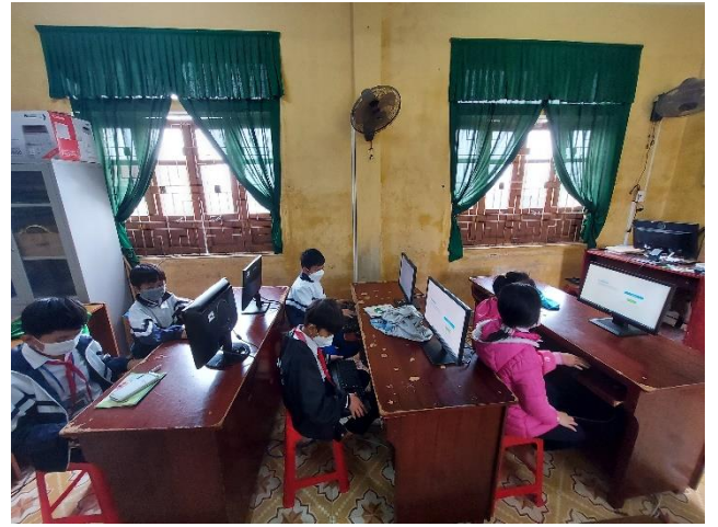
Cửa sổ phòng tin học không đóng kín được, làm mưa gió bay vào phòng tin trong mùa mưa bão