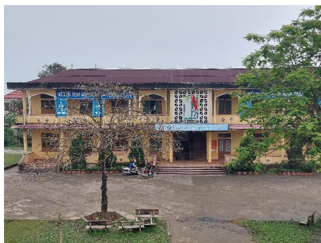
Ảnh chụp mái tôn đã xuống cấp mặt trước nhà 2 tầng