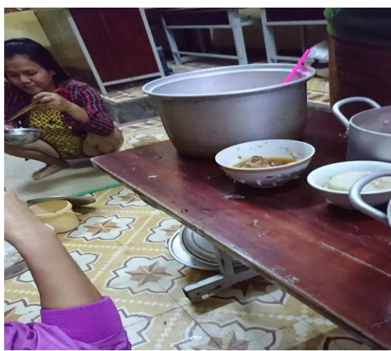
Hình ảnh người dân nấu ăn tại trường khi bão, lụt đến