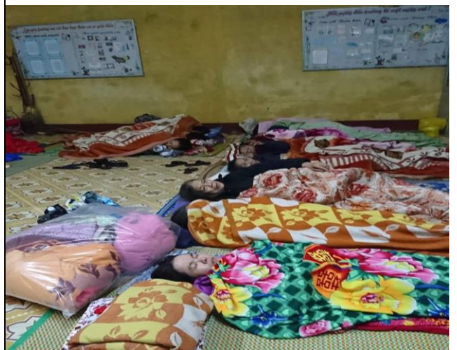
Hình ảnh người dân ngủ tại trường khi bão, lụt đến